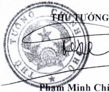
Phạm Minh Chính